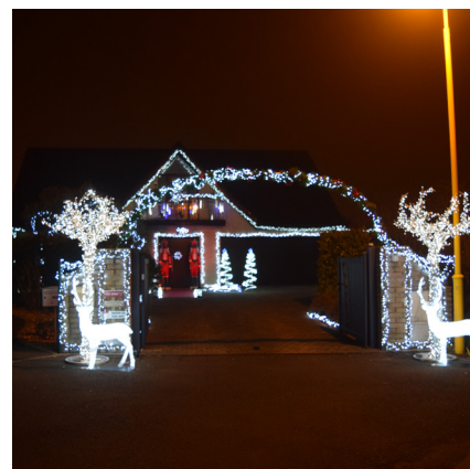
3 ème prix