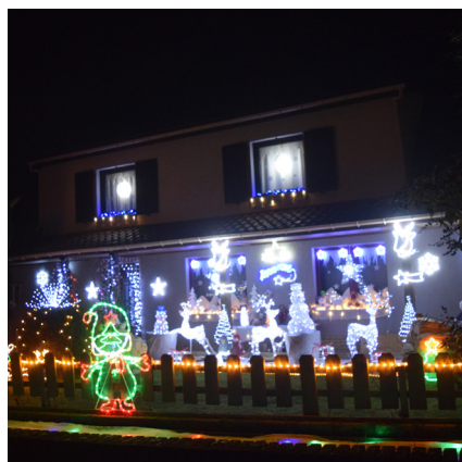
2 ème prix