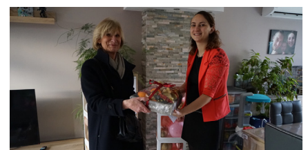
Bienvenue à l'entreprise "Au jour du Oui"

Marckois, des enfants et des jeunes, des activités pour les seniors. Nous mettons tout en place pour que notre tissu commercial soit dynamique et l'offre conséquente, de façon à continuer de faire de Marck un endroit où il fait bon vivre et ainsi offrir à votre famille le cocon nécessaire à son épanouissement. Je souhaite la bienvenue aux nouveaux gérants de "Fleurs toutes couleurs", "Oh pizza" et "Au petit Snack".