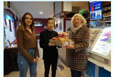
Bienvenue au nouveau gérant du "Saint-Éloi"

Et enfin, nous lançons une dernière étude, un projet que la population marckoise attendait depuis longtemps : la création d'une médiathèque . Nous voulons que notre médiathèque soit un véritable lieu de vie où tout le monde peut se rencontrer et se rassembler autour d'évènements culturels, musicaux, et d'expositions,... mais pas que ! Cette étude permettra de déterminer le lieu d'implantation, la surface de l'équipement et le coût. Tant pour la construction que pour le fonctionnement. En effet, contrairement aux autres intercommunalités de France, la médiathèque sera entièrement à la charge de la commune puisque cette compétence ne relève pas de Grand Calais Terres & Mers.