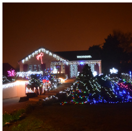
1 er prix

Merci à l'ensemble des participants qui ont contribué à embellir notre ville pour cet hiver 2021 !