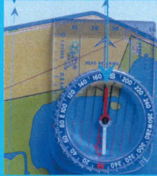
Flèche du Nord de la carte

Pour orienter la carte avec une boussole, vous devez mettre les flèches du Nord de la carte parallèles à la flèche du Nord de la boussole.