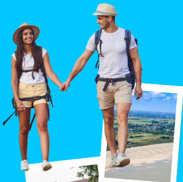
LA FERME DES AIGRETTES